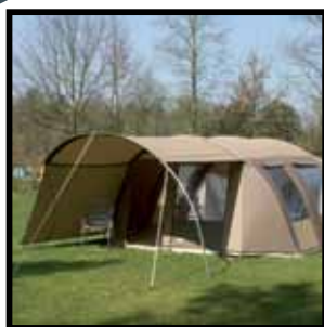
Optie: zijluifel aan beide zijden te gebruiken.