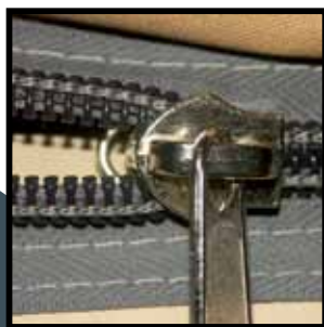
Spiraalritssluitingen in zowel tent als grondzeil.