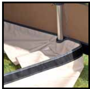
Afneembare slikrand onder luifel.