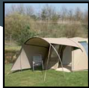
Buizerd inclusief dakluifel en zijluifel links.