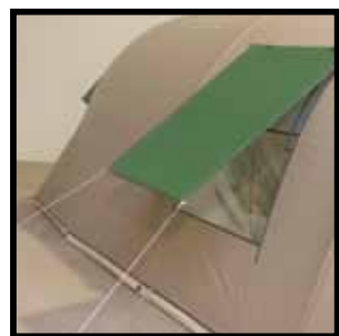
Ventilatie in zijwand ook te gebruiken tijdens regen.