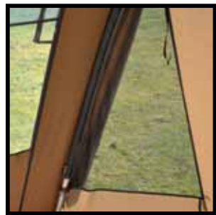
Afsluitbare ventilatiepanelen in voorwand.