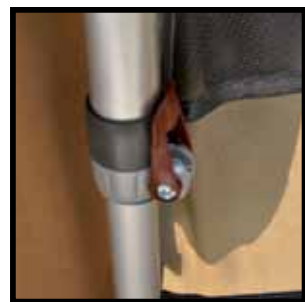
In hoogte verstelbare stokken d.m.v. power-grip klem.